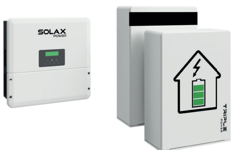
SolaX Power - accupakket