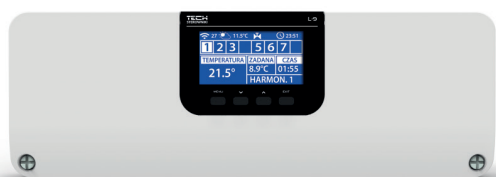
TECH - naregeling