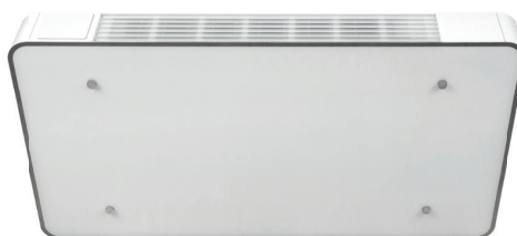
Eplucon FS - convectoren