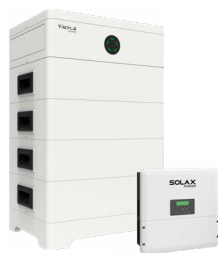
SolaX Power - stapelbare batterij en omvormer