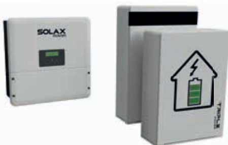
SolaX Power - accupakket