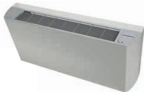
Frost - convectoren