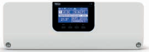
TECH - naregeling